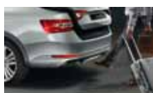
Virtuální pedál – bezdotykové otevírání 5. dveří