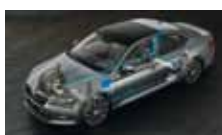
Adaptivní podvozek – volitelné nastavení podvozku ve 3 režimech (Comfort, Normal, Sport)

ŠKODA usnadňuje život svým zákazníkům každý den.