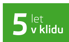
Předplacený servis na 5 let / 100 000 km při financování od ŠKODA Finance