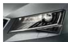
Smart Light Assist – automatické přepínání a clonění dálkových světel